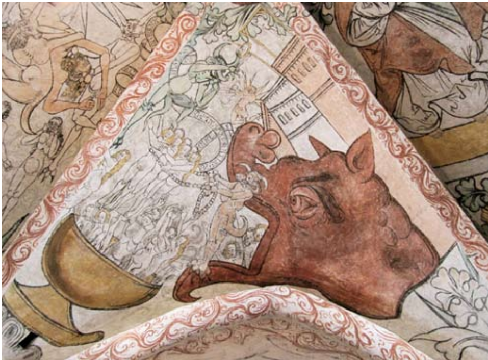
Illustration ur hikuin 40: Helvetesframställning i Hjärsås kyrka, Skåne. 1500-talets början. Foto Lars Berggren 2012.

Boken kostar 150 dkr + frakt. För beställning kan man vända sig till förlaget Hikuins utgivare Jens Velle (jens.vellev@cas.au.dk) eller en av bokens redaktörer, Martin Wangsgaard Jürgensen (Martin.W.Jurgensen@natmus.dk).