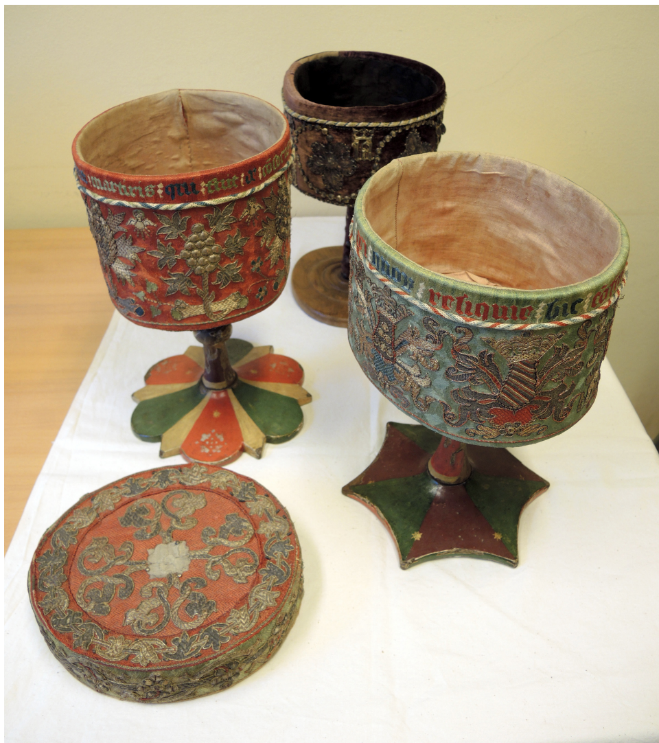
Fig. 2. De tre broderade Vadstenarelikvarierna på fot (inv. nr SHM 349:1–3). Relikaskarna låg i den heliga Birgittas stora relikskrin – ursprungligen troligen tillverkat i Vadstena, klätt med röd sammet – när det återbördades till Sverige som krigsbyte från Polen 1656. Den lila asken fick en ny fot på 1700-talet och endast en av askarna har kvar sitt lock. Insriptionen på den röda asken lyder: Detta huvud tillhör en helig martyr som var bland S Gereon martyrens kamrater (Istud capud est vnnis sancti martiris qui fuit de co[n]sociis gereonis mertiris). Texten på den gröna asken är ett citat ur den birgittinska liturgin men nämmer ingen individ.

de fem Vadstenarelikvarierna går att följa ända fram till idag. Tre av dem hör sedan 1700-talets början till statens historiska samlingar, nu i Historiska museet i Stockholm (SHM 349:1–3, fig. 2). Dessa tre broderade relikvarier förvarades i det röda relikskrinet av sammet (nu i Vadstena) när det kom tillbaka till Sverige efter en drygt femtioårig vistelse i Polen under första halvan av 1600-talet. 4 Ett av de fem relikvarierna från 1595 års lista förefaller ha försvunnit därefter, medan ett av dem med stor sannolikhet är identiskt med det broderade relikvarium på fot som sedan åtminstone slutet på 1600-talet, hör till Linköpings domkyrka. 5 Det är det sistnämnda relikvariet som denna artikel ger en ny tolkning (SHM 3920:6, figs. 1, 3, 4 och 5).