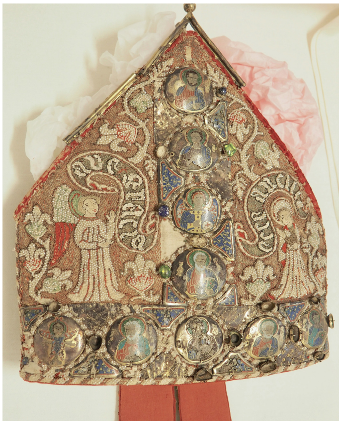
Fig. 6. Linköpingsbiskopen Kettel Karlssons (Vasa, 1459–65) mitra. Vissa av de runda emaljerna passas enligt Axel Romdahl i formatet in på en del av det broderade Linköpingsrelikvariets förlorade ornament. Bilden visar mitrans framsida, utan nackband. Inv.nr SHM 3920:1.

The mitre of the Bishop of Linköping Kettel Karlsson (Vasa, 1459–65). Some of the round enamels fit in format with a number of the reliquary's lost ornaments, according to Axel Romdahl (1929). The image shows the front side of the mitre, without the nape bands.