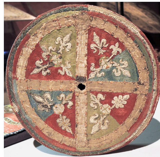
Fig. 5. Locket till det broderade relikvariet är uppdelat i åtta fält i rött, blått och grönt. Det beige band som formar ringkorset/den birgittinska nunnekronan har en gång varit rött och täckt av gyllene silverbleck. Rester av ett oxiderat silverbleck sitter kvar intill knopphålet i mitten på locket. Ringkorsets skärningspunkter har haft något större förgyllda ornament. De vita ytorna har varit täckta av emaljer och sötvattenspärlor. Längs med ytterkanten sitter band och flätor för att täcka den yta som uppstod när asken utökades.

Att kuppans sex stora ornament har varit heltäckande, eftersom de partierna lämnar lärften synlig idag, nämndes ovan. Vart och ett har omgetts av broderade mindre ornament som varit täckta av sötvattenspärlor och inramade med kontur av metalltråd. Enstaka kvarlämnade små pärlor vittnar om vilka ytor som varit pärltäckta. De tidigare pärltäckta ytorna har genomgående vit linnebotten. Det första stora ornamentet (räknat från vänster mot höger från sammanfogningsskarven) har en yttre dekor av fem pärltäckta lobar (figs. 3–4). På det andra består decorationen av fem liljor, det tredje har fem fembladiga löv, det fjärde sju hjärtformade blad, det femte fyra klivna akantusblad med hjärtformad mitt och det sjätte pryds av tio cirklar på korta skaft. Dessa sex runda ornament och några av de på lockets sarg, diskuterades av Axel L. Romdahl 1929. Han menade att relikvariet troligen pryts av samma typ av runda emaljplattor som Kettil Karlssons (Vasa) mitra (SHM 3920:1), se fig. 6. 14 Romdahl identifierade tre huvudsakliga format på mitrans runda emaljer. Ett format stämde överens med de sex stora ornamenten på asken (5 cm diameter) och ett annat format stämde med vissa av ornamenten på lockets sarg (3,4 cm diameter). 15