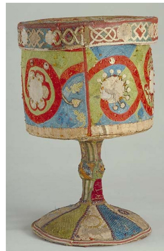
Fig. 4. Det broderade Linköpingsrelikvariet med tillhörande lock. Trästommen är helt överdragen med broderi som varit prytt med applicerade ornament. Det röda vertikala bandet på kuppan markerar sammanfogningskarven. Det beige bandet i nederkanten av asken har varit rött, liksom det ringkorsformande bandet på locket. De vita fälten har prytt av emaljer och sötvattenpärlor.

Sketch of the ornamental tendril on the reliquary's upper case. Along the upper edge are the wedges that create rays. The symmetrically arranged dotted roundels mark now lost decorations. The right side displays the asymmetry created at the joint.