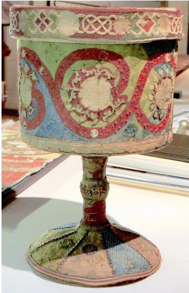
Fig. 1. Linköpingsrelikvaret. Dep. i Linköpings domkyrkomuseum, inv. nr SHM 3920:6.

The reliquary from Linköping. Now in the Diocesan Museum of Linköping Cathedral, Sweden.