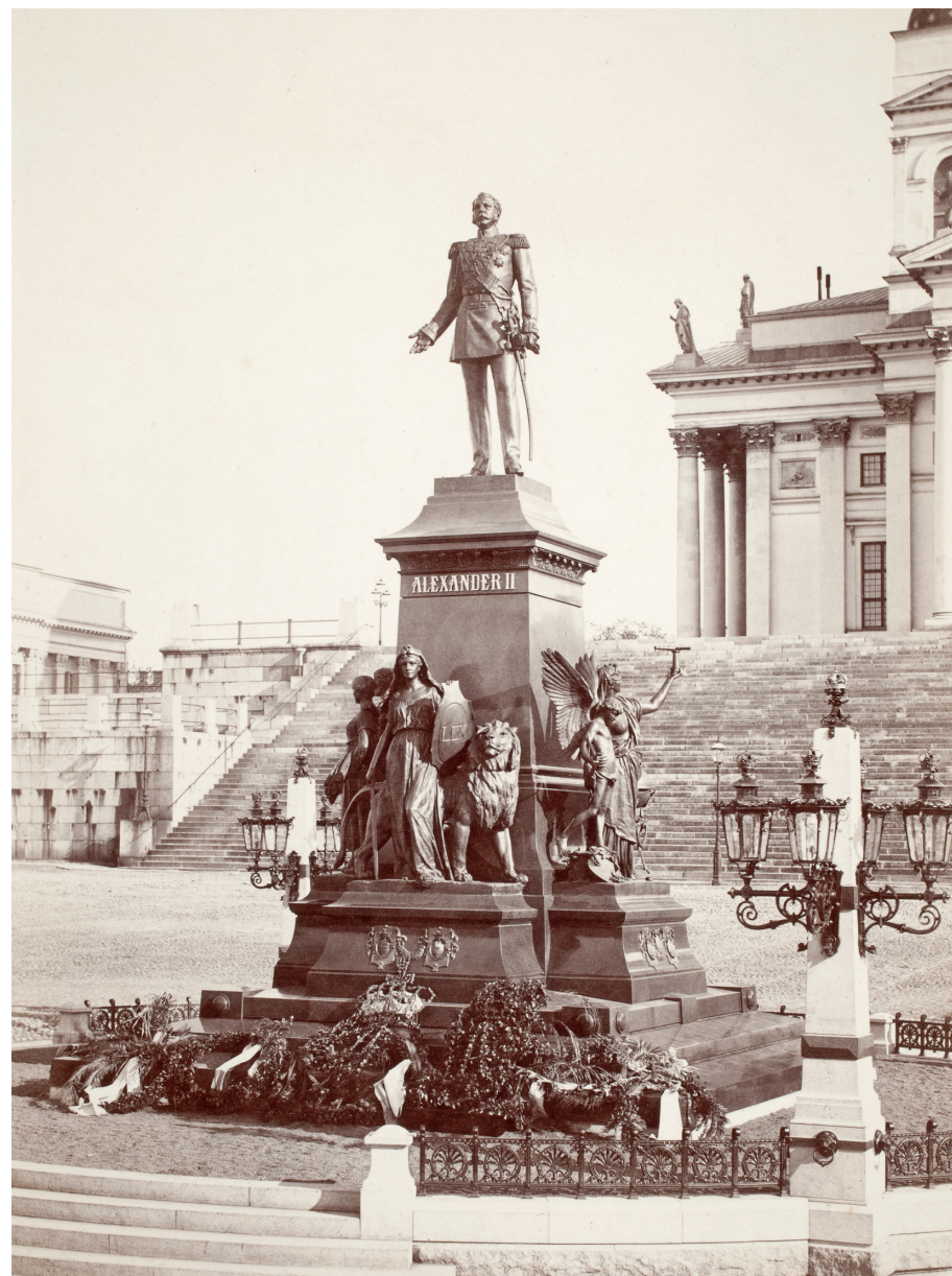
Monumentet tillägnat Alexander II på Senatstorget i Helsingfors, av Walter M. Runeberg och Johannes Takanen.

Det avsnitt som benämns "Teoretisk referensram" inkluderar teoretiska perspektiv, men de återfinns allt som oftast mellan istället för på raderna. Frågan om monuments tillkomst, reception och eventuella förstörelse i sig kan sägas vara en teori eller ett teoretiskt perspektiv förblir obesvarad. Att det teoretiska ramverket inte har någon stor generaliserbarhet, har bidragit till att de resultat som betonas har mer att göra med de frågor som utgår från rekonstruktionsaspekter, snarare än de symboliska och processuella dimensionerna. De senare får förvisso ett visst utrymme, framför allt i anslutning till aspekter av förryskning och avrussificering samt de skiftande politiska konjunkturen som kan bidra till att monumentens funktioner och innebörder genomgår förändringar över tid. Där emot återfinns begreppsliga uppdelningar och klagöranden som är teoretiska till sin karaktär, men dessa begreppsliga diskussioner har inte fått någon konsekvent ut-