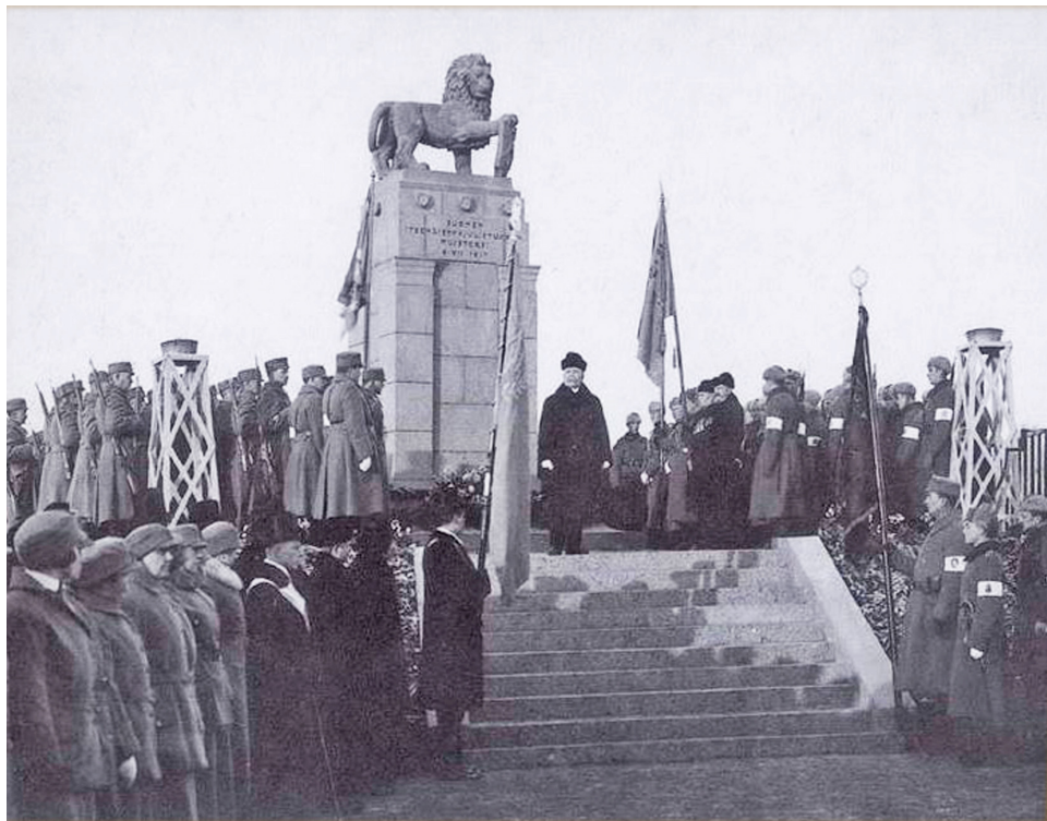
Det viborgska lejonet på sin piedestal vid invigningen 6. december 1927. Den finska inskriptionen lyder i översättning "Till minne av den finländska självständigheten 6. XII.1917" och vapenskölden är den karelska.

bekosta det nödvändiga underhållet. Den största utmaningen ägde rum 1917, då monumentet delvis förstördes av revolutionära ryska marinsoldater. Att monumentet, i enlighet med 1800-talets stilideal, var utformat som en obelisk hade måhända kunnat rädda den om det inte vore för att den kröntes av den ryska dubbelörnen placerad på ett klot. Aittomaa följer i sin fortsatta redogörelse vägen mot rehabilitering, vilken föregicks av en lång period då Kejsarinnans sten var stympad.