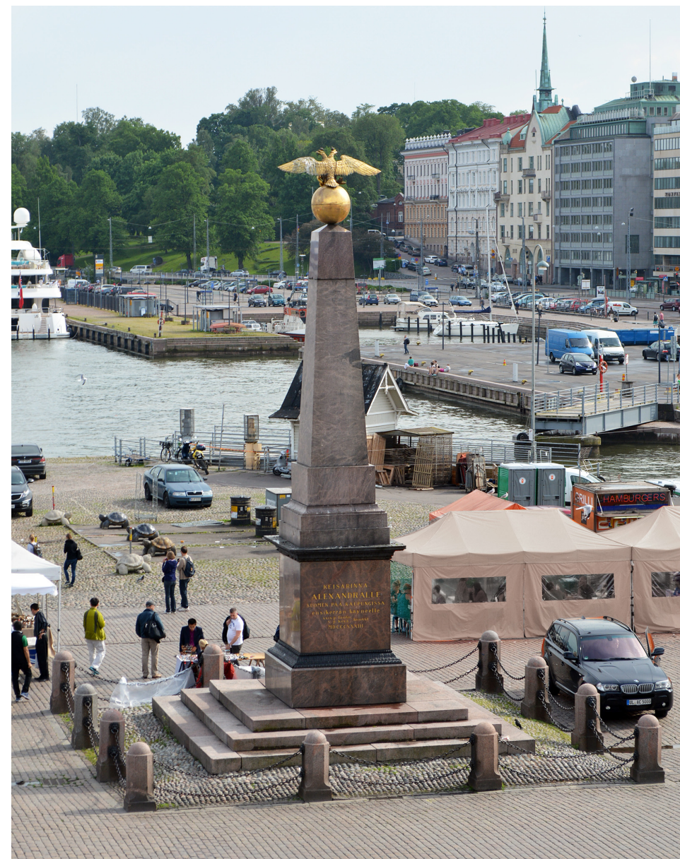
"Kejsarinnans sten" på Salutorget i Helsingfors. En obelisk av granit, krönt av en förgylld dubbelörn, ritad av Carl Ludvig Engel och rest till minne Nikolaj I:s och hans gemål Alexandra Feodorovnas (född Charlotte av Preussen) besök i Helsingfors 1833.

Att monument löper stor risk för vandalisering är en återkommande tematik. Den belyses bland annat med Kejsarinnans sten i Helsingfors. Förvisso var den problematisk redan i det tidiga 1900-talet på grund av oklara ägandeförhållanden, vilket bidrog till oklarheter kring vem som skulle