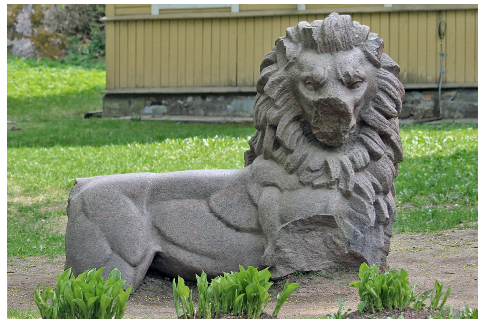
Det finländska lejonet, utfört i granit av Gunnar Finne och avtäckt i Viborg 1927. Nu i Monrepos, strax utanför Viborg. Foto Anders Mård 2018.