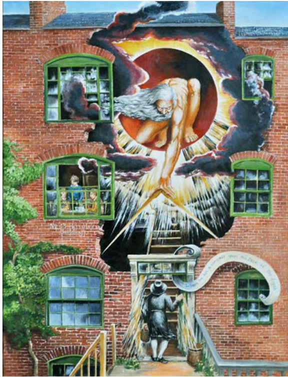
Fig. 2. Bo Ossian Lindberg, William Blakes vision av "The Ancient of Days" 1793. Målning i akryl på duk, utförd i Lund ca 1980.

arkivstudier, egna experiment och egen verksamhet som bildkonstnär och illustratör. Vilka pigment som används i målningar från olika tider, var, när och hur de applicerades, på vilka underlag – allt sådant klargjordes inte bara i teorin utan i handfast praktik. Den stora utställningssalen högst upp i universitetshuset förvandlades till en gammaldags konstnärsverkstad, där man rev färgpigment, grunderade linnedukar och pannåer, målade med laserande skikt – och studerade gamla och nya konstverk med mikroskop och i ultraviolett belysning. En annan nyhet var kursen i byggnadsdokumentation, där studenterna inte bara undervisades i arkitekturbeskrivning och -terminologi utan från grunden fick lära sig hur man mätte upp och dokumenterade äldre byggnader och dessutom fick omsätta kunskaperna i praktiskt fältarbete.