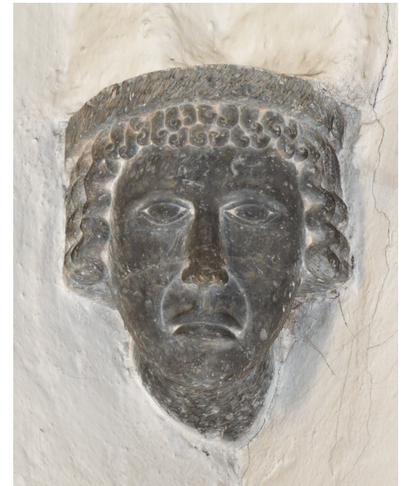
Vä kyrka, porträtthuvud i långhusets nordvästra hörn.

minstone har man trots det fram till nu. I tidigare forskning har man antagit att det i Vä rörde sig om antika spolier som importerats långväga ifrån, eftersom det i Norden varken fanns lämpligt stenmaterial eller tillräcklig kunskap för sådana företag. Här kan Ödman bidra med en överraskande nyhet: med hjälp av geologiska analysmetoder kan han visa att precis samma stenart finns tillgänglig i det omedelbara grannskapet, och argumenterar övertygande för att kolonnerna faktiskt kan ha tillverkats på plats i Vä.