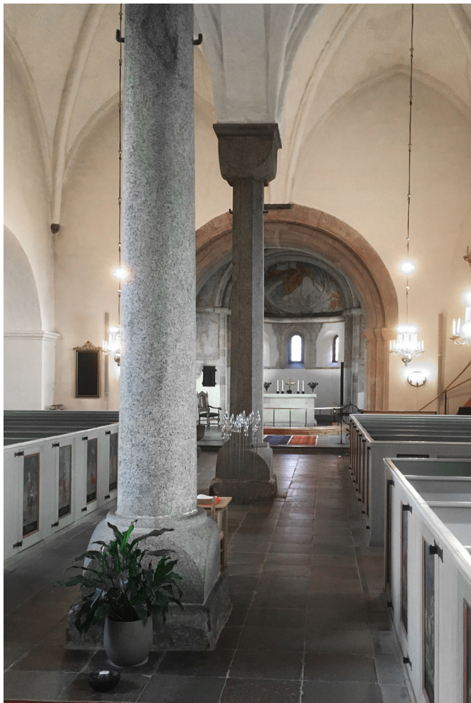
Vä kyrka, interiör mot öster med de båda granitkolonnerna.

Dick Harrison ger i det inledande kapitlet med titeln "Anno 1100: En betraktelse över Nordeuropa, Skåne och Vä" en översikt av samhälle och maktförhållanden i Norden under den aktuella perioden. Framställningen är koncentrerad och späckad med namn på hövdingar, stormän, jarlar och kungar som alla på ett eller annat sätt är släkt med varandra, något som emellertid inte hindrar dem från att mer eller mindre oavbrutet strida om herraväldet över olika land-