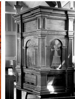
Fig. 14 a-c. Prædikestolen i Kirkjubæjar, Island, udateret.

Pulpit of the church of Kirkjubæjar, Iceland, undated (before 1588).