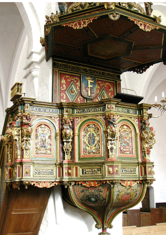
Fig. 12 a-c. Prædikestolen i Sankt Olai Kirke i Helsingør, 1567.