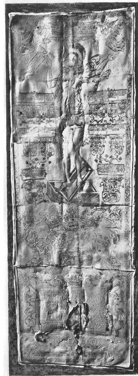
Fig. 20. Låget på dronning Sophies kiste. Foto, efter Opmaalinger af Foreningen af 3die December 1882, bd. 4, 1914.

alogier florerede en stund i Danmark, men havde ikke nogen begrundelse i et gammelt kongerige, hvor man jo godt kendte kongerne gennem tiden. Her skulle man som konge ikke kunne bevise sin byrd, men derimod sin legitimitet – og den lå i en balance mellem den oldenborgske stamme og rigsrådet. Siden 1660 blev genealogierne helt overflødige, fordi det arvekongedømme, der af gavn havde eksisteret siden Christian I, nu formelt blev stadfæstet med arvekongeriget og Kongeloven.