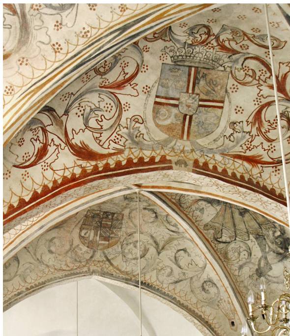
Fig. 2. Kalkmalerier med Christian II's og dronning Elisabeths våben i hvelvene i Udbyneder kirke, før 1523.

Murals showing the arms of King Christian II and Queen Elizabeth (of Habsburg) in the village church of Udbyneder. Before 1523.