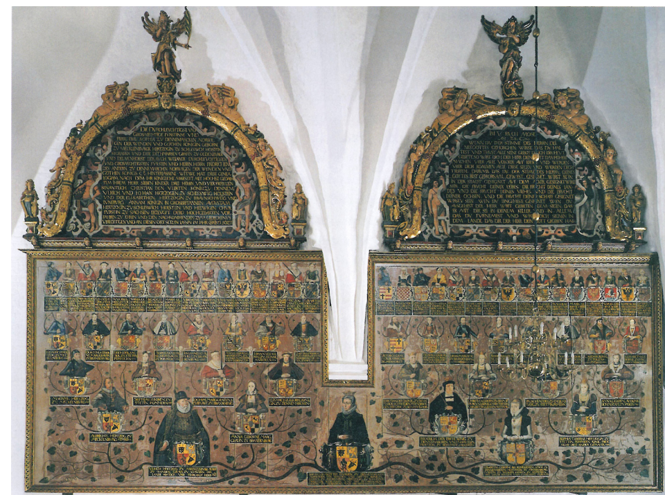
Fig. 16. Dronning Sophies Anetavle i Nykøbing kirke på Falster, 1627. Efter Bach-Nielsen 2002.

The huge tablet displaying the ancestors of Queen Sophie in the former convent chapel of Nykøbing on the Island of Falster, 1627.