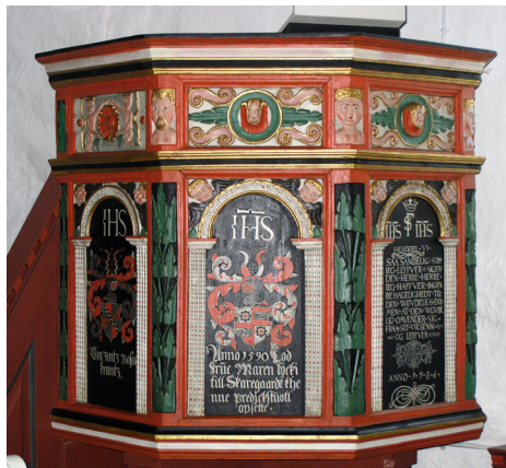
Fig. 13 a-b. Prædikestolen i Sønder Dråby Kirke, 1586.