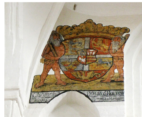
Fig. 5 a-b. Kalkmalede kongelige markeringer i koret af Sankt Olai Kirke, Helsingør, c. 1559.

lens pragtudfoldelse var Hack Ulfstands opførelse af en hel gravkirke for sig selv og sin familie i Gennerup, Genarp i Skåne. Dette var sammen med adelens almindelige begravelsesskik en så stor udfordring, at kongen måtte begrænse dens pragtudfoldelse gennem begrænsninger af luksus. Hertil hørte også forbuddet i 1576 mod at adelen lod indrette ophøjede tumbaer i kirkernes kor. Egentlige fritstående grav-