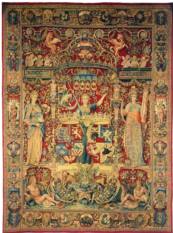
Fig. 8. Rygstykket under bordhimmelen fra Kronborg, 1585-1586. Nationalmuseum, Stockholm.

The back of the Kronborg canopy, 1585-1586. Nationalmuseum Stockholm.