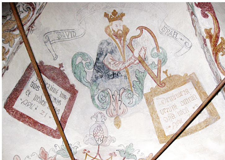
Fig. 6. Kalkmaleri af Kong David eller Frederik II i Tøstrup Kirke, 1582.

Mural depicting King David or King Frederik II of Denmark, Tøstrup Church, 1582.