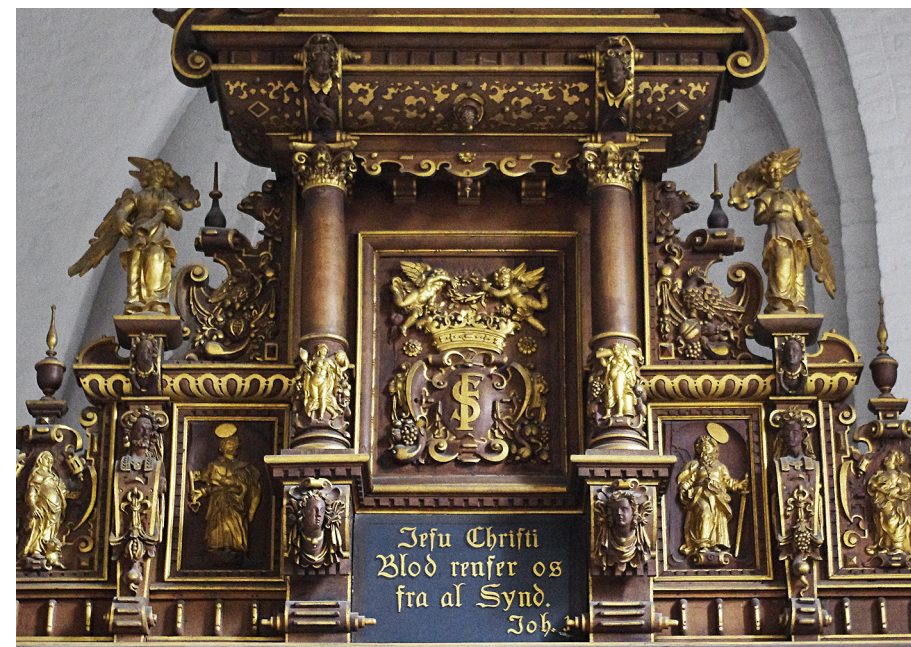
Fig. 18. Topstykke fra altertavlen i Nykøbing Falster Kirke, 1616.