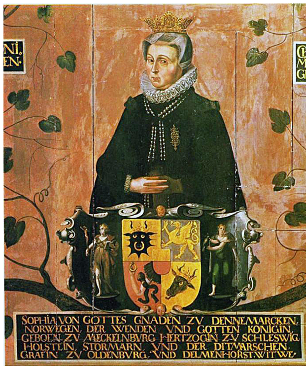
Fig. 17. Dronning Sophie. Detalje af Anetavlen i Nykøbing kirke, 1627. Efter Bach-Nielsen 2002.

Portrait of Queen Sophie. Detail of fig. 16, the tablet displaying the Queen's ancestors in Nykøbing Church, 1627.