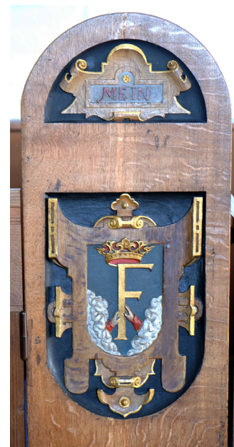
Fig. 9 a-b. Stolestadegavle Skanderborg Slotskirke med henholdsvis Frederiks og Sophies initialer, der bæres mod himmelen, 1570'erne.

Pews of the royal chapel of Skanderborg with the initials of Frederik II and Queen Sophie, 1570-1580.