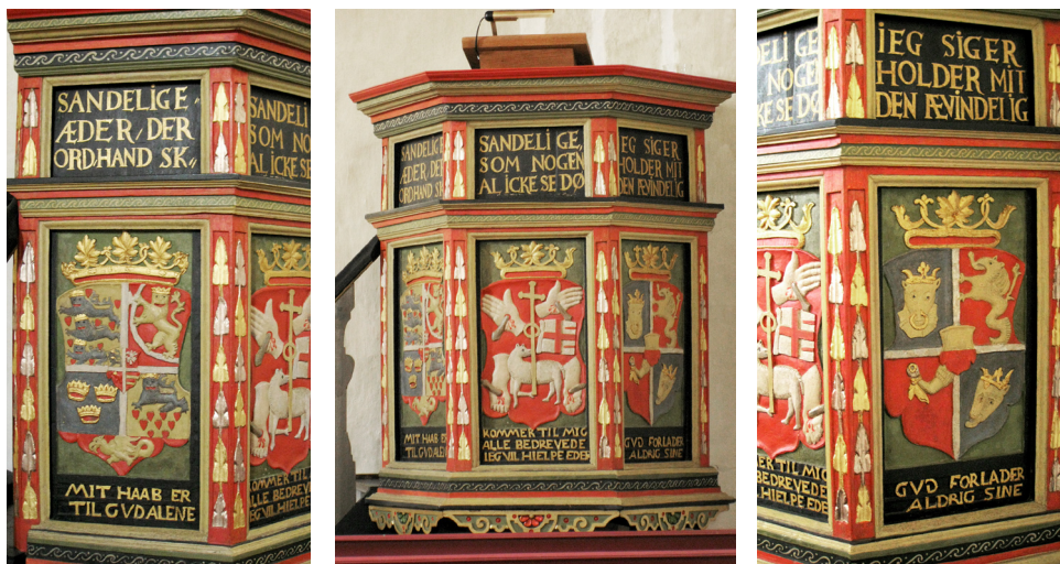
Fig. 10 a-c. Prædikestolen i Søften Kirke, 1572-1588. Pulpit of the village church of Søften, 1572-1588.

standelsesfanen i rød-hvide farver. Da ligger en identifikation mellem Frederik og Kristus snublende nær. 11