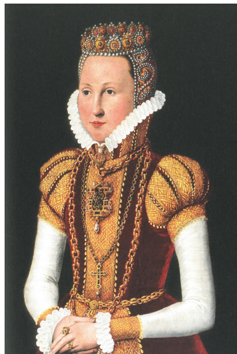
Fig. 3–4. Frederik II malet af Hans Knieper 1581. Dronning Sophie malet af Hans Knieper 1572. Det nationalhistoriske Museum på Frederiksborg.

Frederik II painted by Hans Knieper, 1581. Queen Sophie (of Mecklenburg) painted by Hans Knieper, 1572, The Museum of National History, Frederiksborg.