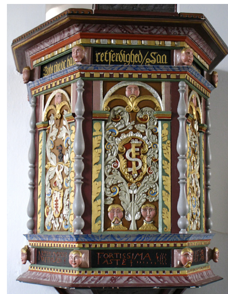
Fig. 11 a-b. Prædikestolen i Hvejsel Kirke, 1582. Pulpit of the village church of Hvejsel, 1582.

I kirken i landsbyen Hvejsel nær Vejle (Vejle Amt, Nørvang Herred) findes en prædikestol fra 1582. Den har fremfyldninger med snitværk (fig. 11 a-b). Den første viser et fabeldyr med noget snitværk. Den næste slægten Fastis våbenskjold. Den midterste har Frederik II's eller Frederik og So-