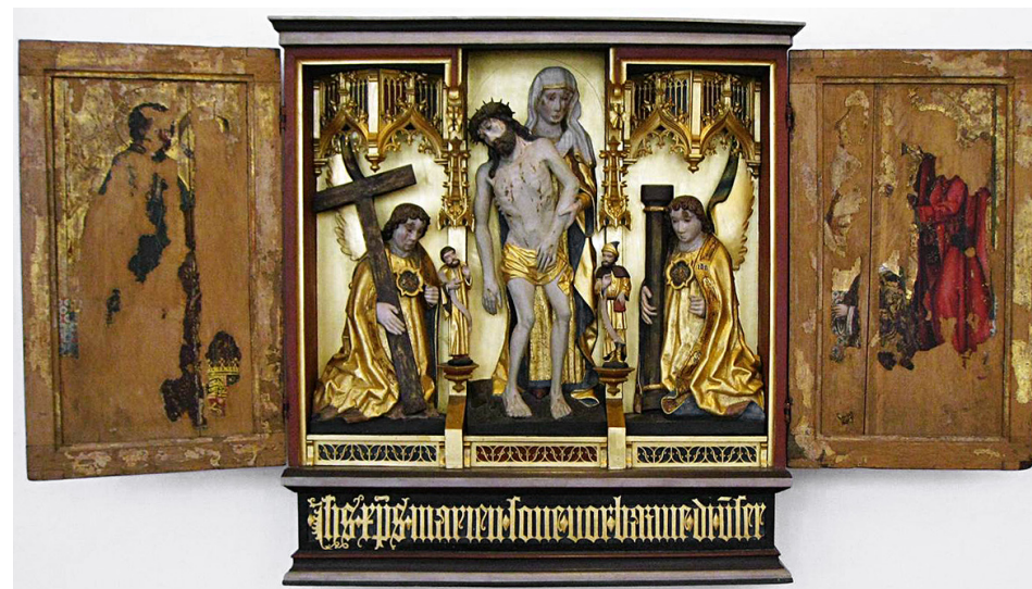
Fig. 1 a-b. Thurøaltertavlen, muligvis fra Bernt Notkes værksted, ca. 1490, Nationalmuseet, København.

At messeklæder undertiden kunne bære stiftermarkeringer bekræftes af en korkåbe af grøn brokade med efterfølgeren, Kong Hans' kongevåben, anevåben og det danske flag, Dannebrog, som ligeledes findes i Nationalmuseet i København. Kong Hans' dronning Christine var levende interesseret i genealogi og stod bag flere stiftelser. Hendes største stiftede gave skabtes i andet tiår af 1500-tallet, nemlig Claus Bergs altertavle og inventaret i Gråbrødrekirken i Odense, hvor man så 64 udskårne og malede våbenskjolde, der dannede rammen om den kongelige begravelse.